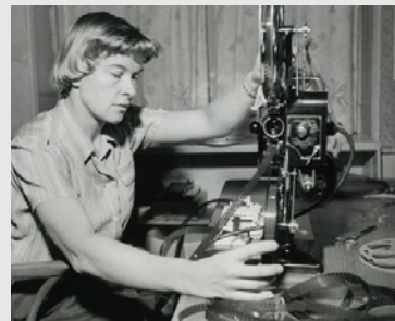
Se også den danske instruktør Jette Bang's Inuit (1940) fra serien Kvinder & film

Vi præsenterer tre dokumentarfilm fra hver sin epoke og med hvert sit unikke blik på Nordatlanten. Den ældste er en enestående Islandsfilm fra 1939, Billeder fra Island , som introduceres af filmdagenes Birgir Thor Møller, og fra 1990'erne viser og drøfter dokumentaristen Ulla Boja Rasmussen sin film fra Færøerne, 1700 meter fra fremtiden (1990). Og afslutningsvis er det Lasse Laus lyriske dokumentarfilm Lykkelænder (2018), der udforsker og udfordrer gængse forestillinger om grønlandsk identitet, hvilket vi debatterer med ham og flere af folkene bag filmen.