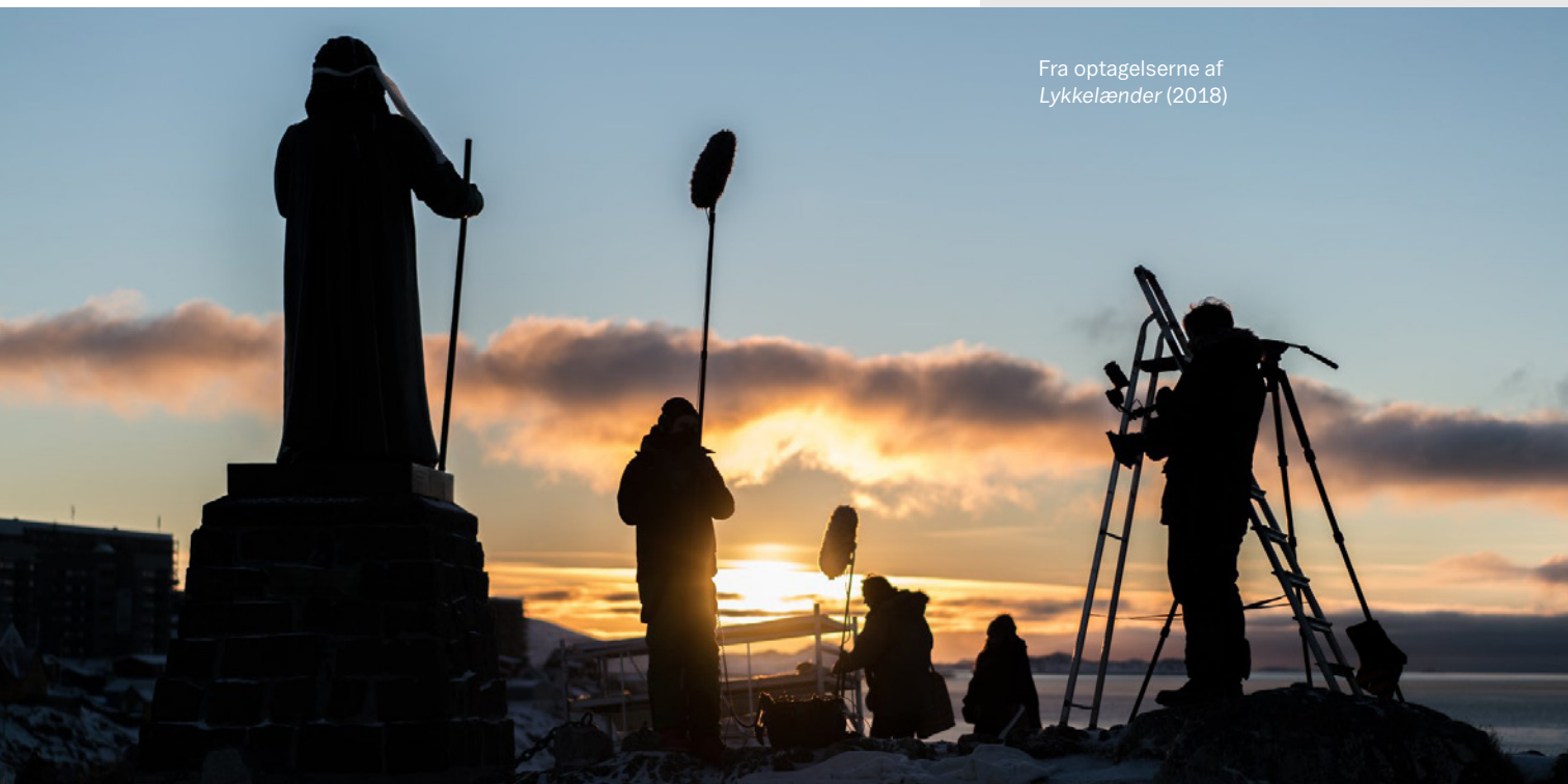
Fra optagelserne af Lykkelænder (2018)